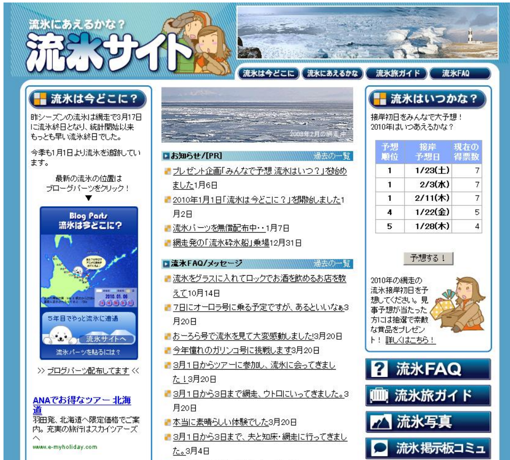
■ 図1：流氷サイト・トップページ